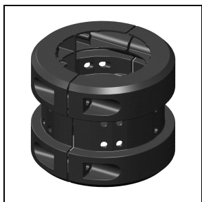
14099696 Fixation mât en aluminium peint pour mâts Ø 90 mm ■ AN-g6 / Anthracite métallisé