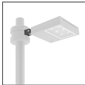
311043 Bride de fixation ■ AN-g6 / Anthracite métallisé