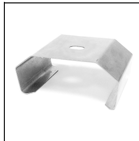
3100244 Halierungen zur Schnellmontage an der Decke aus Edelstahl (50 Stück)