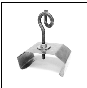
3100245 Halierungen zur Schnellmontage an der Decke aus Edelstahl + Haken (2 Stück)