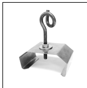
3100246 Halierungen zur Schnellmontage an der Decke aus Edelstahl + Haken (50 Stück)