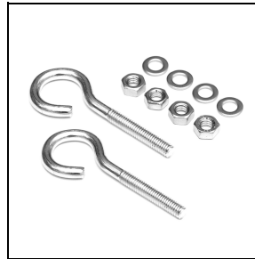
310550 Aufhängung mit Kette