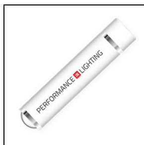
14469720 USB-Stick für PC zur drahtlosen Programmierung