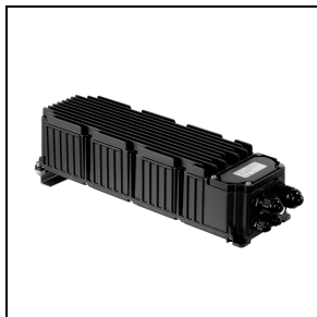
3109421 Driver box 1500 - 1.4 A - 3 CH - DALI