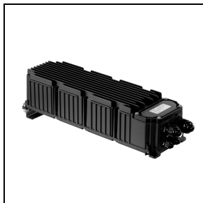
3109423 Driver box 1000 - 1,4 A - 2 CH - DALI