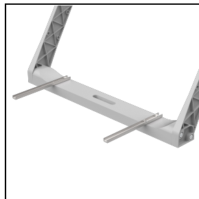
3117476 Bevestigingbeugels voor driver ■ INOX / RVS

Om een constante actualisering van haar producten te bevorderen, behoudt PERFORMANCE iN LIGHTING zich het recht voor om zonder voorafgaande kennisgeving, wijzigingen aan te brengen. Daarom is het altijd aan te raden om de laatste versie te lezen die op de website www.performanceinlighting.com is gepubliceerd. Geleverde lumenoutput en stroomverbruik, inclusief verliezen, zijn onderhevig aan een tolerantie van +/-7%. Tenzij anders vermeld, gelden de waarden bij een omgevingstemperatuur van 25°C. De garantievoorwaarden zijn beschikbaar op https://www.performanceinlighting.com/qr/company/led-warranty