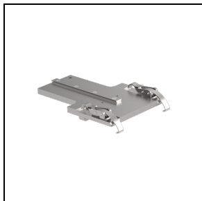
3109552 Steun voor richter