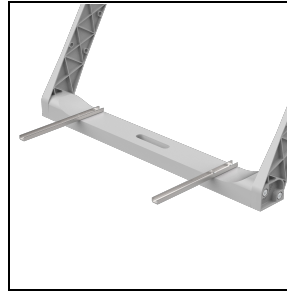
3117476 Bevestigingbeugels voor driver ■ INOX / RVS

Om een constante actualisering van haar producten te bevorderen, behoudt PERFORMANCE iN LIGHTING zich het recht voor om zonder voorafgaande kennisgeving, wijzigingen aan te brengen. Daarom is het altijd aan te raden om de laatste versie te lezen die op de website www.performanceinlighting.com is gepubliceerd. Geleverde lumenoutput en stroomverbruik, inclusief verliezen, zijn onderhevig aan een tolerantie van +/-7%. Tenzij anders vermeld, gelden de waarden bij een omgevingstemperatuur van 25°C. De garantievoorwaarden zijn beschikbaar op https://www.performanceinlighting.com/qr/company/led-warranty