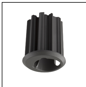
3106386 Adapter mast \varnothing 42÷46 mm ■ AN-g6 / Antraciet