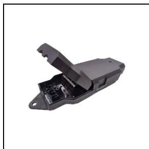
3122585 Module Casambi externe BK-81 / Noir