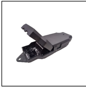
3122585 Module Casambi externe BK-81 / Noir