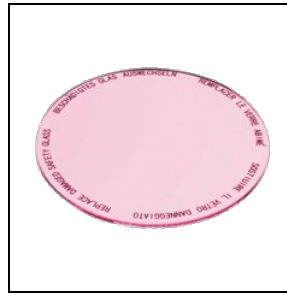
8433961 Lebensmittelfilter für Fleisch- und Wurstwaren