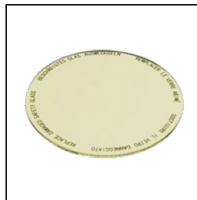
8433963 Lebensmittelfilter für Obst- und Käsewaren