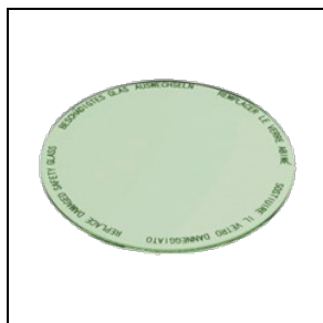
8435964 Lebensmittelfilter für Gemüsewaren