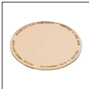
8435962 Lebensmittelfilter für Backwaren