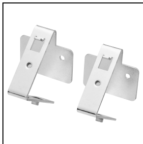
GWS3191 Muurbeugel 30°/45°