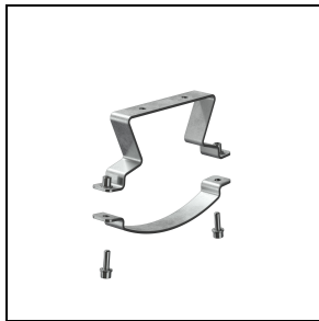
GWS3296 RVS beugel van AISI 316L