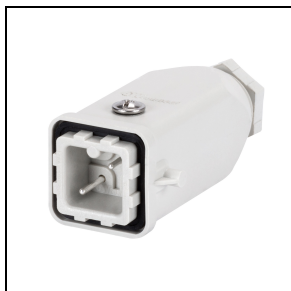
GWS3194 Mannelijke 4-polige connector 10 A