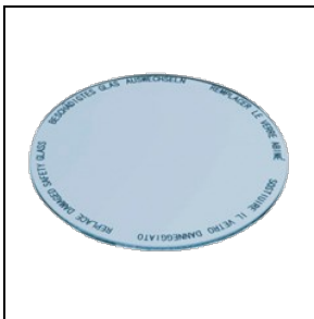
8435965 Lebensmittelfilter für Fischwaren