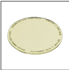
8435963 Lebensmittelfilter für Obst- und Käsewaren