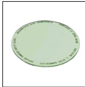
8435964 Lebensmittelfilter für Gemüsewaren