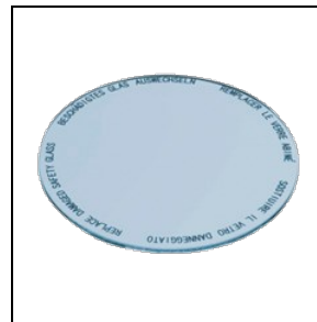
8435965 Lebensmittelfilter für Fischwaren

Um die ständige Aktualisierung unserer Produkte zu fördern, behält sich PERFORMANCE IN LIGHTING das Recht vor, Änderungen ohne vorherige Ankündigung vorzunehmen. Daher wird immer empfohlen, die neueste Version zu lesen, die auf der Website www.performanceinlighting.com veröffentlicht ist. Gelieferte Lumenleistungen und Stromverbrauch, einschließlich Verluste, unterliegen einer Toleranz von \pm 7\% . Wenn nicht anders angegeben, gelten die Werte für eine Umgebungstemperatur von 25°C. Die Garantiebedingungen sind unter https://www.performanceinlighting.com/gr/company/led-warranty