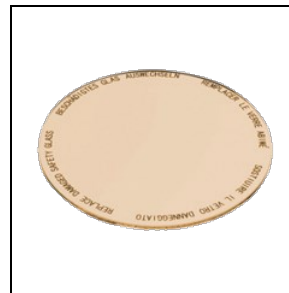
8435962 Lebensmittelfilter für Backwaren