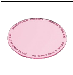
8435961 Lebensmittelfilter für Fleisch- und Wurstwaren